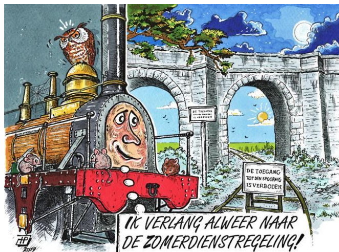
Cartoon: Hans Proper