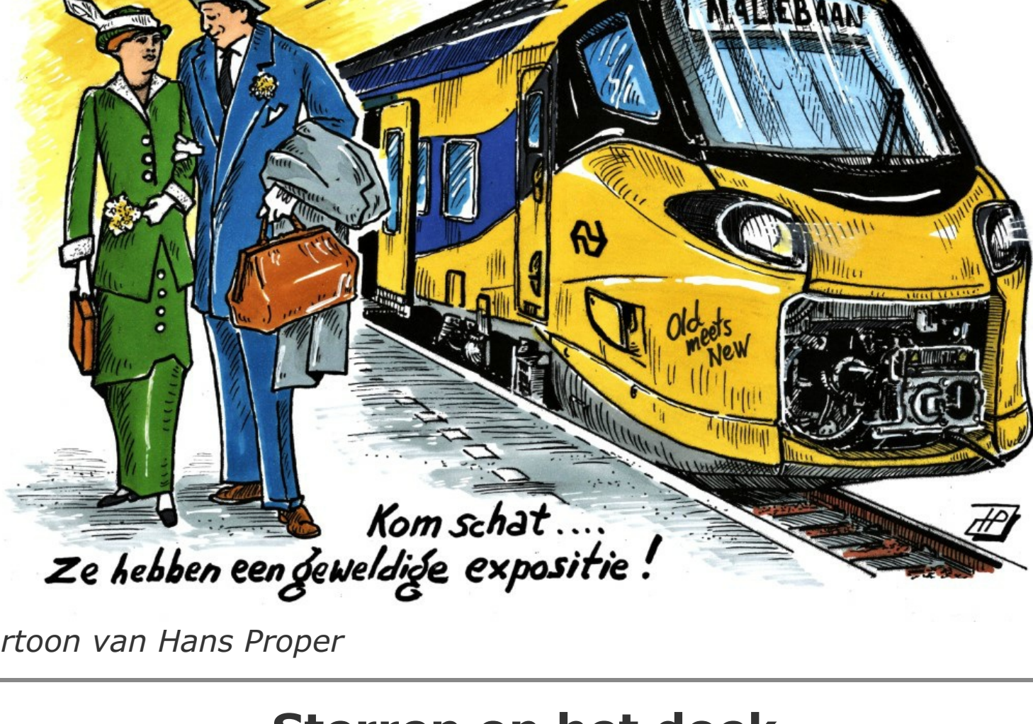
Cartoon van Hans Proper