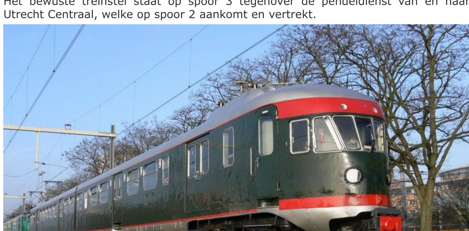
Het complete treinstel, bouwjaar 1952.

Het bewuste treinstel staat op spoor 3 tegenover de pendeldienst van en naar Utrecht Centraal, welke op spoor 2 aankomt en vertrekt.