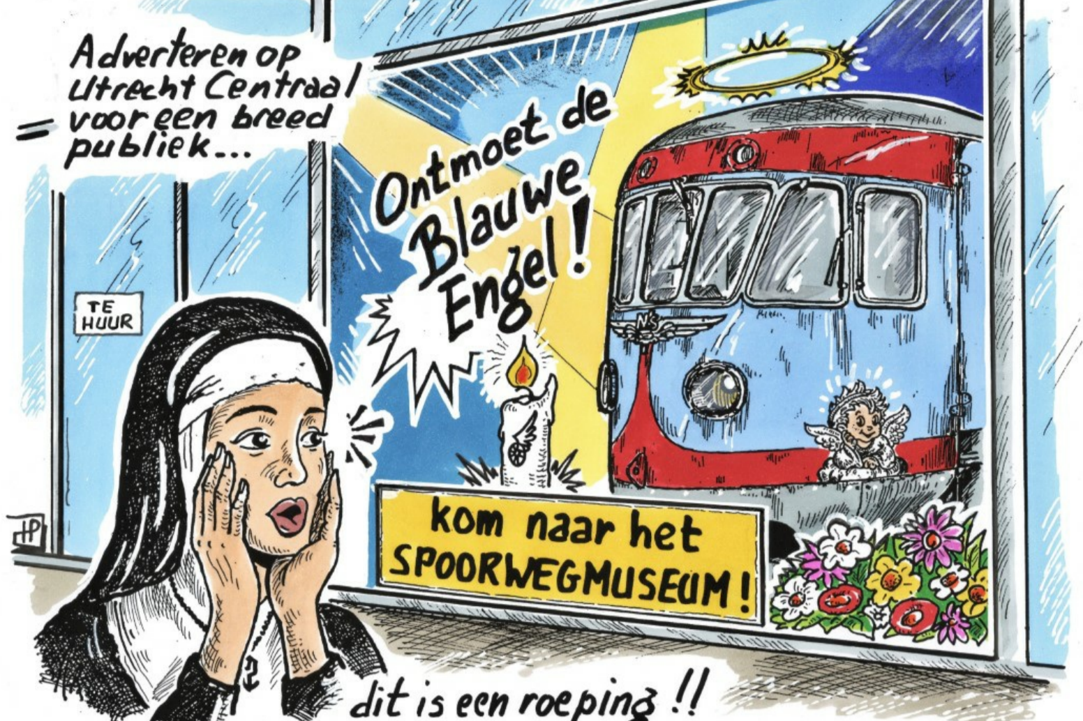
Cartoon van Hans Proper